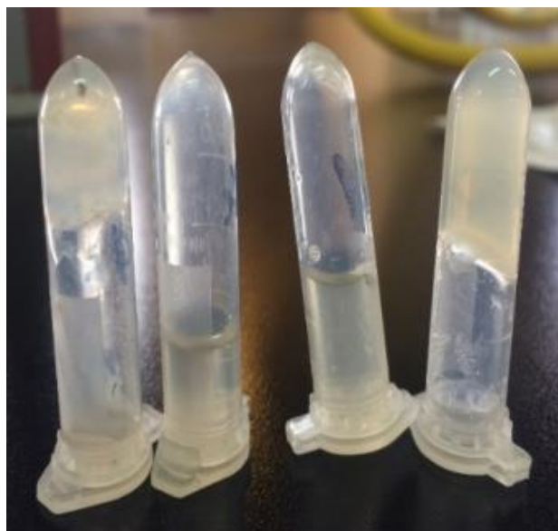
شکل ۲- پلاسمای سیتراته‌ی لخته شده خرگوش